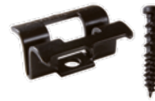
Clip Inox Cobra® 24