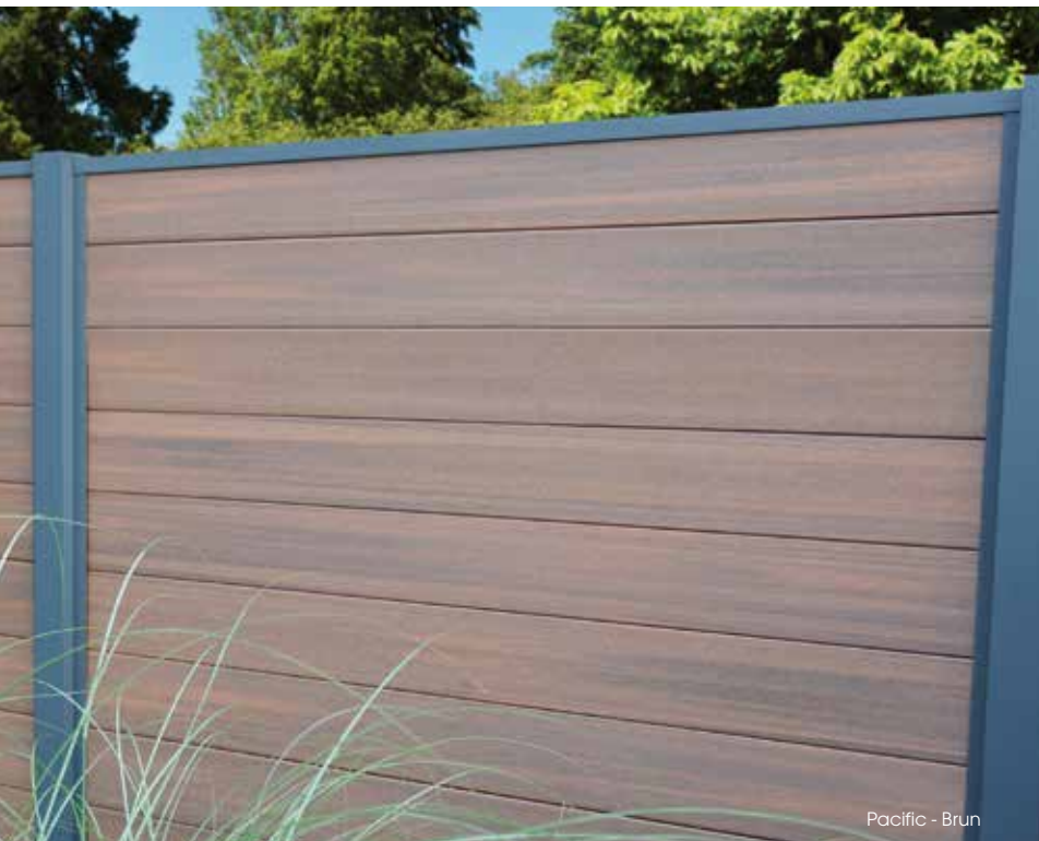
Pacific - Brun